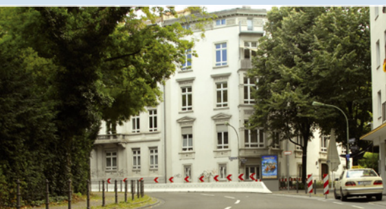
EP-GRIP auch für sichere Stadtstraßen: In dieser Kurve ereigneten sich jedes Jahr zahlreiche Unfälle. Der Unfallschwerpunkt in der City von Frankfurt/M. wurde mit EP-GRIP erfolgreich entschärft.

Die Beschichtung lässt sich nach dem Aufbringen schnell wieder nutzen und ermöglicht eine außergewöhnliche städtebauliche Gestaltung. Darüber hinaus können auch Grünflächen ansprechend in umliegende Areale integriert werden.