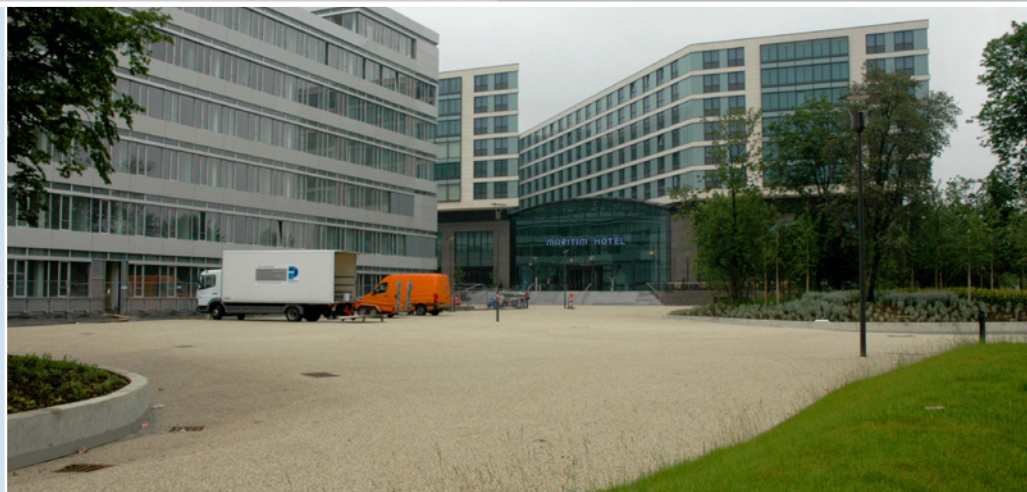
Schicke Strandatmosphäre mitten in der Düsseldorfer Airport-City: Der Vorplatz des Maritim-Hotels ist mit hellem EP-GRIP beschichtet. Der Belag ergänzt das Farbenspiel der Außenwände des Hotels harmonisch und vermittelt eine positive Atmosphäre. Gleichzeitig hellt er die Umgebung bei Dunkelheit auf und ermöglicht durch die griffige Oberfläche auch bei Nässe oder Eis einen sicheren Zutritt.

Der EP-GRIP-Belag besteht aus einem Bindemittel auf Basis von Reaktionsharzen, in das ein hochpolierresistentes Gemisch von Gesteinskörnungen eingestreut wird. Die speziell ausgewählten Gesteinskörnungen steigern die Reibung zwischen Reifen und Fahrbahn und sorgen für die gewünschte Griffigkeit. Außerdem weist der EP-GRIP-Belag eine ausgezeichnete Drainwirkung auf. Damit bieten die Beläge auch bei Regen und Nässe optimalen Grip.